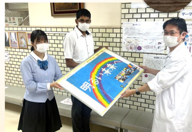
浜松修学舎様から、医療従事者へのエールとして万羽鶴アートのポスターパネルが寄贈されました。総合受付横の壁面に掲示しています。