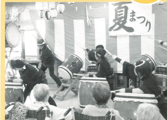
西病棟夏まつり...楽しいひとときを過ごしました

医療法人社団 盛翔会 浜松北病院 大瀬介護保険センター おおせの郷(シヨトステイ) 訪問看護ステーション大瀬 訪問リハビリテーション大瀬 おおせデイサービスセンター おおせ第二デイサービスセンター