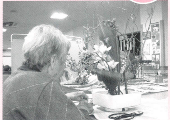
おおせデイサービス、生花教室にて

医療法人社団 盛翔会 浜松北病院 大瀬介護保険センター おおせの郷(ショートステイ) 訪問看護ステーション大瀬 訪問リハビリテーション大瀬 おおせデイサービスセンター おおせ第二デイサービスセンター