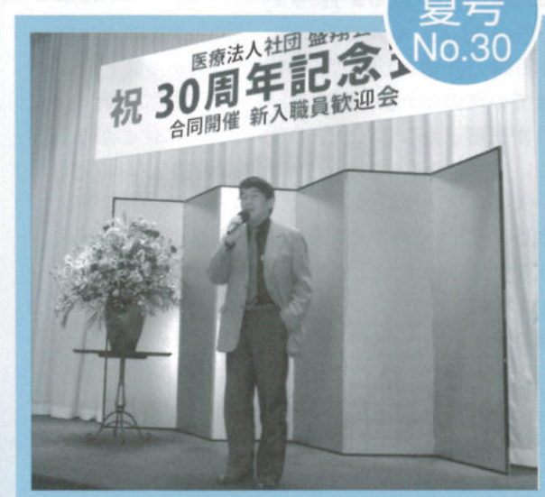
4月吉日、医療法人社団 盛翔会 開院30周年式典・新入職員歓迎会が執り行われました。