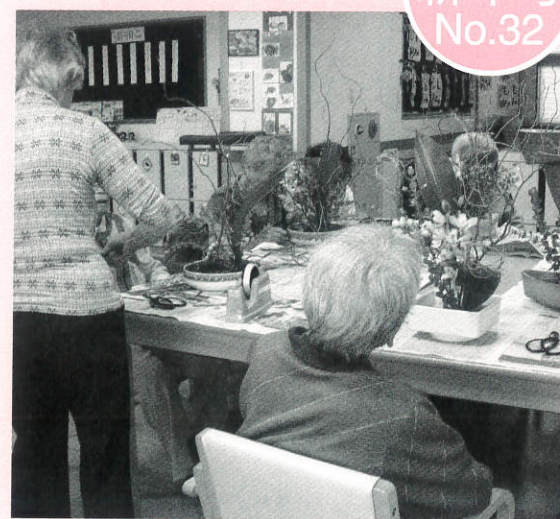
おおせデイサービス生け花教室の様子です。今年もよろしくお願いします。