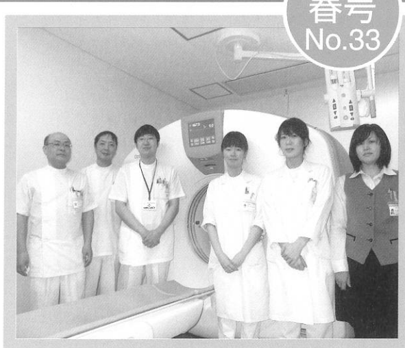
患者様の立場に立った検査を心掛けています。 (放射線科 スタッフ一同)