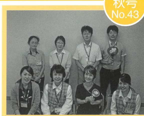
医療福祉支援センター一同