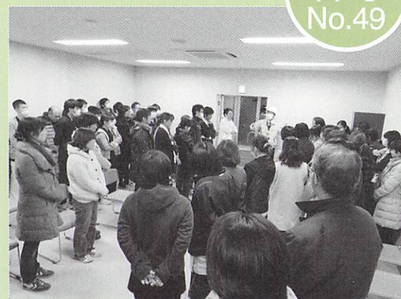
★今年度、最後の防災訓練の様子です! 災害時の救助体制につき考え、行動しました。