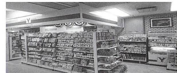
当院の売店：限られたスペースですが、陳列の美しさが自慢です。

その他、グラットでは、本館一階で売店を営業させて頂いています。十坪足らずの店舗面積ですが、二千品目以上を取り扱っております。今後もお客様のニーズにお応えできるよう努力してまいります。