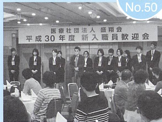
★今年度も、新入職員歓迎会が盛大に行われました。